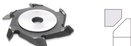
角面カッター Square Surfaces