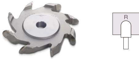
出丸カッター Lobe Rounding

for Profiling : Lobe Rounding / Spoon-Shaped Surface / Quarter Rounded Surface / Rounded Surfaces