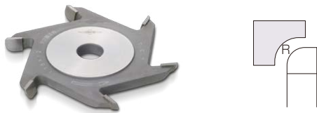
サジ面カッター Spoon-Shaped Surface