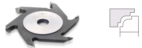
両段サジ面カッター Spoon-Shaped with Stepped Ends