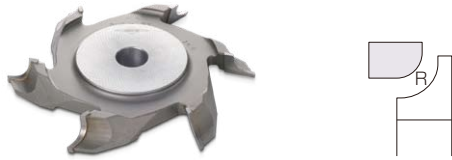
ボーズ面カッター Quarter Rounded Surface

Quarter Rounded Surface / Spoon-Shaped Surface / Square Surfaces / Gourd Shaped Surfaces / Spoon-Shaped with stepped ends / Ginkgo-Nut Shaped Surfaces