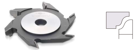
ひょうたん面カッター Gourd Shaped Surfaces