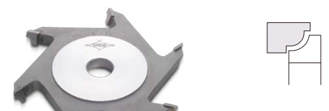
ぎんなん面カッター Ginkgo-Nut Shaped Surfaces