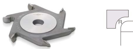
サジ面カッター Spoon-Shaped Surface