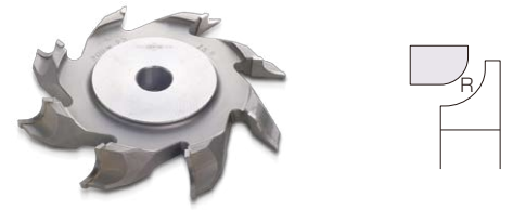
ボーズ面カッター Quarter Rounded Surface